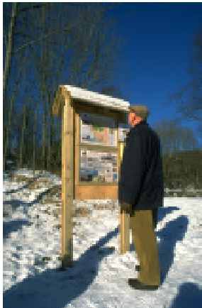
Infotavlen på Øvre Hellen friluftsområde

Kvarven friluftsområde er det også laget tavler som viser forsvarshistorien til tidligere Bergen festning. Alle de nevnte områdene er tidligere forsvarsområder som Friluftsrådet nå forvalter til friluftsmål på vegne av staten eller forsvarset (Kvarven). Friluftsrådet tror det vil være interessant for publikum å synliggjøre områdenes historie og ønsker derfor også å utarbeide informasjonstavler for noen av Bergens ytre befestinger. Aktuelle områder er Håøya, Lerøy, Hagelsund, Nedre Hellen og Skarvøy.