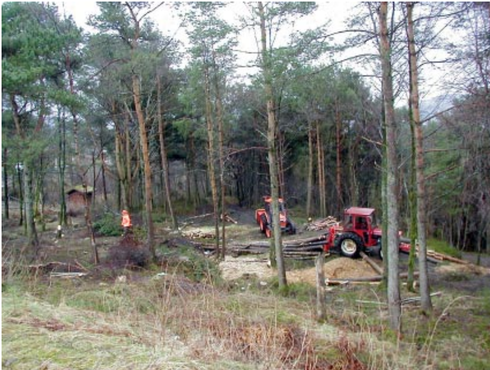
Skogrydding i Grønskjeret friluftsområde i Bergen