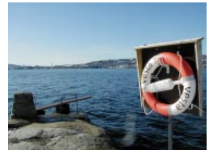
Hærverk og tankeløshet medfører fortsatt at mange redningsbøyer forsvinner i løpet av vinteren. Manglende redningsbøyer vil bli montert før sesongen.

I de fleste av friluftsområdene som grenser mot sjø er det plassert ut redningsbøyer. Hærverk og tankeløshet medfører fortsatt at redningsbøyene fort forsvinner etter at de er blitt satt ut. I løpet av høsten og vinteren er det rapportert at 28 bøyer mangler fra stativene. Mange av friluftsområdene brukes flittig også gjennom vinteren, blandt annet til fiske, det er derfor viktig at livbøylene får henge i fred. Friluftsrådet har i flere år hatt et godt samarbeid med Vesta og før sesongen vil dermed nye bøyer bli plassert ut i de områdene som manglet bøyer etter vinteren.