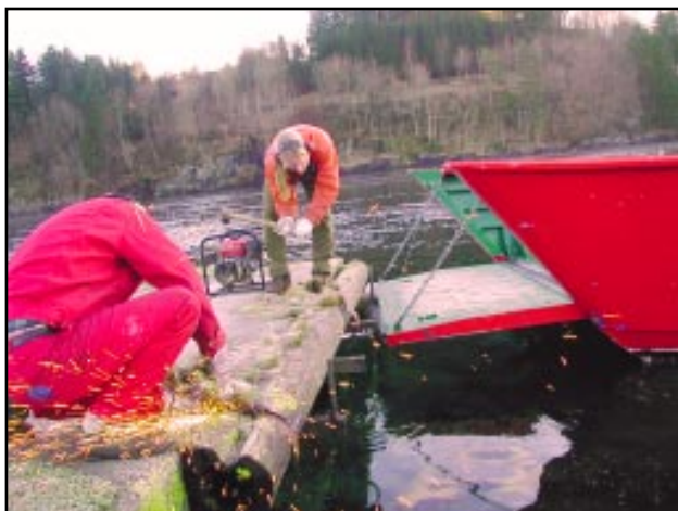
Arbeid i Geitholmen friluftsområde, Lindås

friluftsområde i Lindås vært prioritert. Området ble overtatt i fjor fra BKK. Geitholmen ligger i Alverstraumen og er lett tilgjengelig for båtfolket. Holmen er nå ryddet for gammelt rusk og rask, kaien er fendret og holmen er ryddet for busker og trær som kan være til hinder for bruken av området til friluftformål.