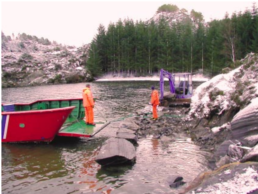
Sjursvika friluftsområde på Askøy

Friluftsrådet driver de fleste friluft og badeområdene i Bergensregionen og arbeider for å sikre nye områder. Friluftsinfo utgis med ugjevne mellomrom for å holde våre kommuner og andre samarbeidspartnere oppdatert om viktige saker og Bergen og Omland Friluftsråds virksomhet.