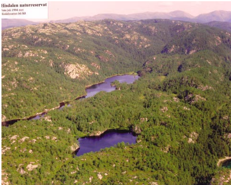
Hisdalen naturreservat strekker seg fra Fanafjellet og ned mot Lysefjorden. Området er vernet som barskogsreservat og Friluftsrådet forvalter to Friluftsområder inn mot reservatet.

i samarbeid med fylkesmannens miljøvern avdeling å merke områdene slik at det blir lettere å finne fram, samtidig som presset på deler av området kan bli mindre. Friluftsrådet vil ta kontakt med aktuelle grunneiere i området slik at en prosess kan komme igang. På sikt kan det være aktuelt å merke stier fra Fanafjell