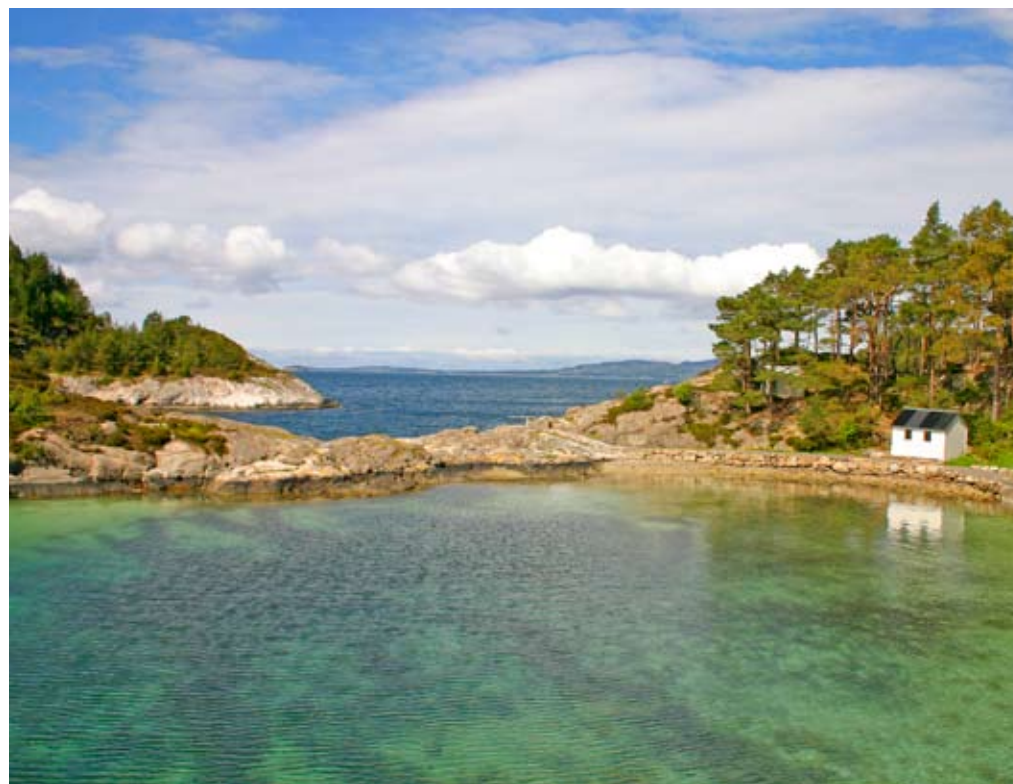
Søre Tednevågen