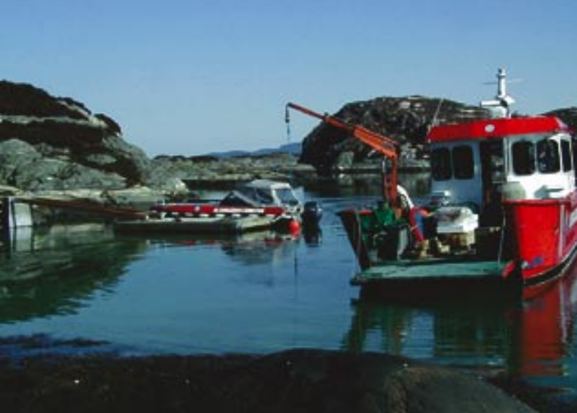
På Horgo i Austevoll ble det montert nytt bryggeanlegg og informasjonstavle.