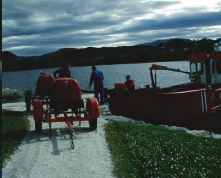
På Lysøya ble det også i år kjørt ut brannpumper