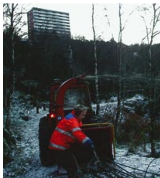
Brunestykket ble rustet opp i 2002. En stor del av arbeidet var rydding av vegetasjon

I Lislevika ble toalettet beist, og i Ormhilleren ble fjæren ryddet. I tillegg var det befaring på Ormhilleren med tanke på utvidelse av parkeringsplassen, i forbindelse med ny reguleringsplan i området.