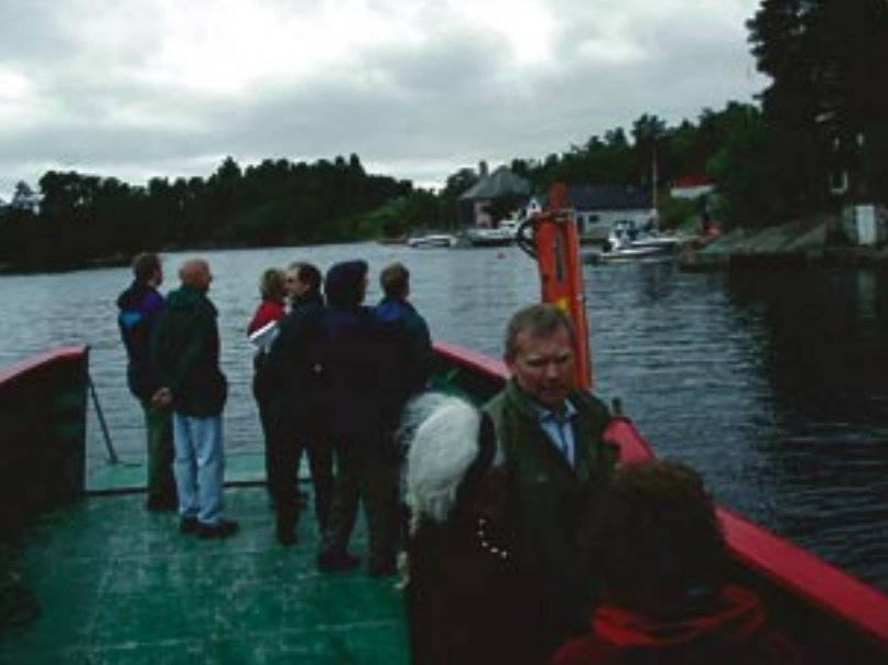
Fra befaring med Bergen kommune i forbindelse med ny Kystsoneplan