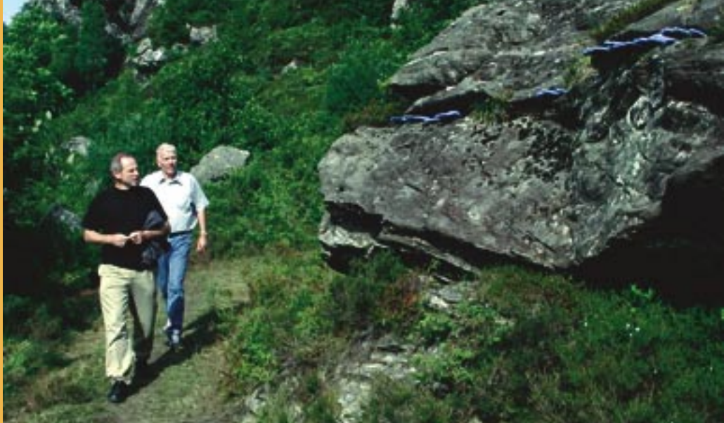
Fra styreturen til Austevoll og Sund, her fra kunstutstillingen i Tyssøy friluftsområde