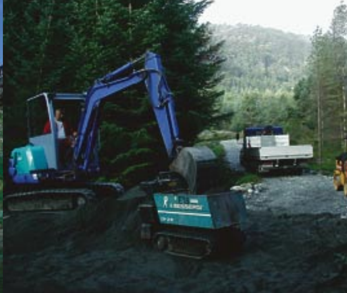
Skutlevika ble fornyet i 2002 blant annet med toalett og bryggeanlegg