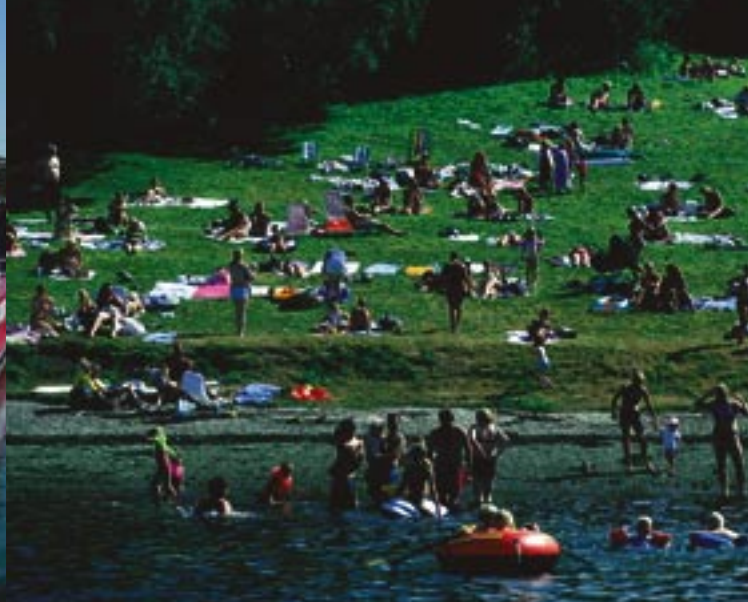
På grunn av den gode sommersesongen ble tilretteleggings og skjøtselssesongen kortere enn vanlig.

leder er medlem i fagrådet til Det norske Arboret på Milde. Administrativ leder deltok i referansegruppen for arbeid med ny Håndbok om juss i strandsonen i regi av Direktoratet for naturforvaltning og i sikringsprosjektet i regi av Friluftsrådernes Landsforbund.