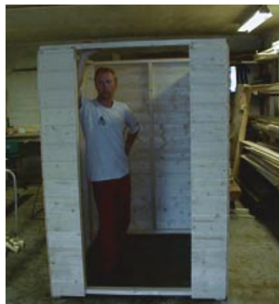
Nytt toalett ble bygget på forhånd i friluftsrådets verksted, før montering på Lønø