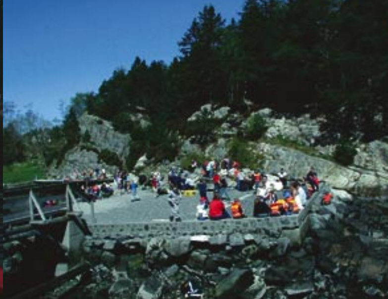
Fra Erdal skoles ryddedag i Solnes Friluftsområde