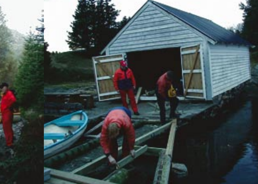
På Skageneset ble det lagt nytt dekke og skjørt på kaien