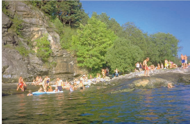
Badeliv i badefjæra på Grønskjeret.

Grønskjeret friluftsområde er et populært bade og turområde med egen badefjære for barn. Området har gangveier ned til badevikene. Parkeringsplassen har plass til omlag 30 biler.