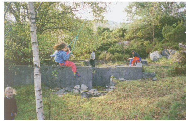
Storøen er et egnet utfartsmål for barnehager og skoler.

Det meste av Storøen er friluftsområde. Øya er lett tilgjengelig med båt og mye brukt. Området er tilrettelagt med stupebrett, brygge og fortøyningsbolter. Eidsvåg båtlag driver båttopplag og slipp på Storøen i vinterhalvåret. Båttopplaget disponerer fire skur på tilsammen 1800 m 2 og en plattning utenfor på 600m 2 .