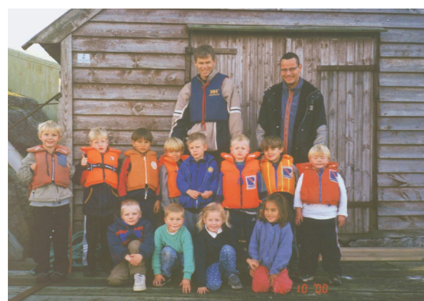
Christinegården barnehage har Storøen som sitt faste utfartsmål på sine turdager.

Med telt kan du fritt overnatte samme sted i utmark og på Friluftsrådets områder inntil 2 døgn i lavlandet, uten å spørre grunneier. Men husk at du aldri skal sette opp teltet nærmere enn 150 m fra hus eller hytte der det bor folk. Vær nøye med å rydde når du drar.