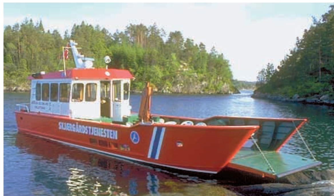
Skjærgårdstjenestens arbeidsbåt, "Frifant".