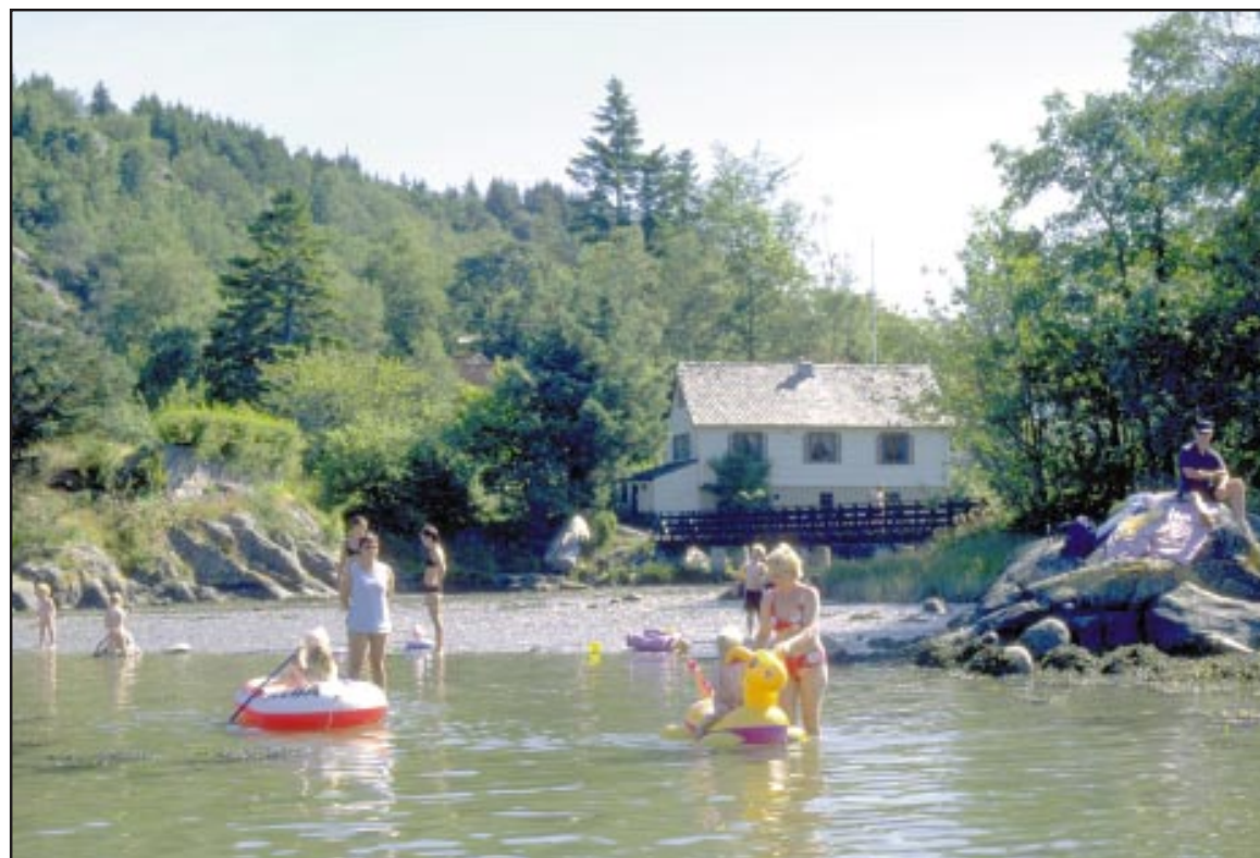
Badeliv i Fløksand Friluftsområde.

Innmark er all dyrka jord; åker, eng, kulturbeite, hage - og i tillegg yngre plantefelt, gardsplass, hustomt og industriareal.