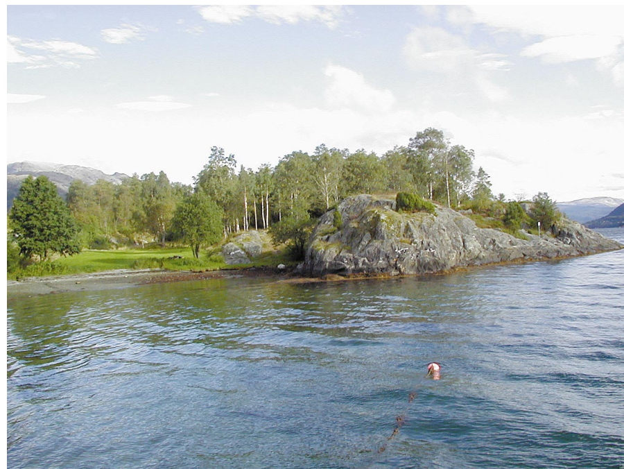
Badevika i Rolvsvåg friluftsområde.

Innmark er all dyrka jord; åker, eng, kulturbeite, hage - og i tillegg yngre plantefelt, gardsplass, hustomt og industriareal.